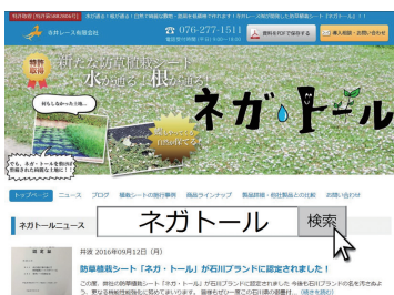
ウェブには施工事例も掲載

品が売上の柱となっていますが、本製品の供給は県内外に広がりつつあり、売上の三本目の柱に成長させるべく、現在、製品の研究に積極的に取り組んでいます。