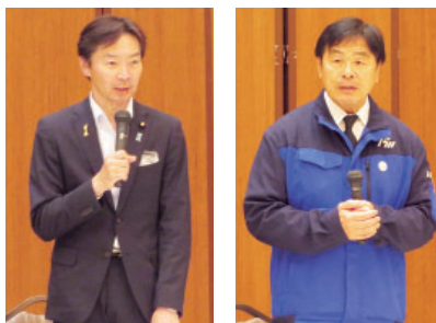
来賓の馳知事（写真右）と宮本参議院議員（写真左）

来賓の馳浩県知事、宮本周司参議院議員が祝辞を述べた。西村聡県産業振興戦略監が臨席した。