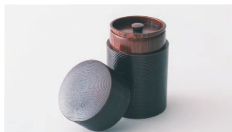
山中漆器と若手職人